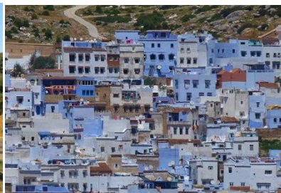
Die blaue Stadt Chefchaouen