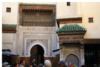
Stadtter in Fes