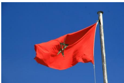
Die marokkanische Flagge

Streckenführung: https://goo.gl/maps/EeWG5BaGT7v