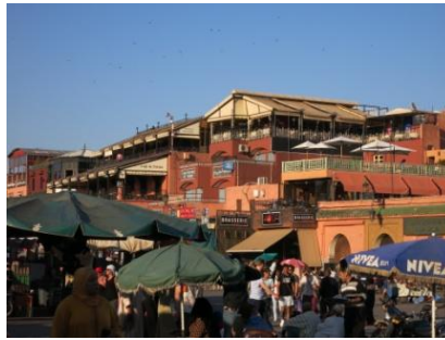
Place Djemaa el-Fnaa