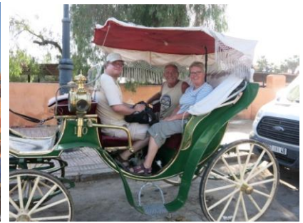
Kutschfahrt ist angesagt

Am Mittwoch, den 30.10. machen wir unser Abschiedsessen auf dem Place Djemaa el-Fnaa.