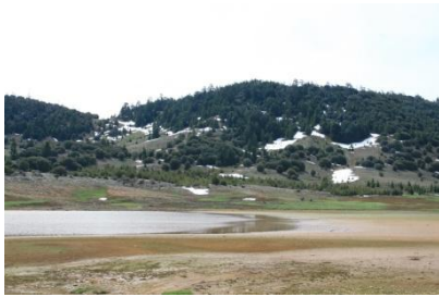
Zedernwälder im Schnee

Streckenführung: https://goo.gl/maps/feQJKHJqfjG2