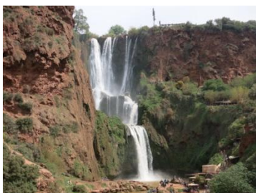
Die Wasserfälle von Ouzoud

Am Freitag nach dem Frühstück besichtigen wir die Wasserfälle, relaxen und genießen im „Zebra“ ein marokkanisches Abendessen, das den Daily-Adventure-Teams speziell zubereitet wird. Am 19.10. machen wir eine Tour in die Berge, versuchen die „Cathedrale Imsfrane“ zu erreichen, um dann im Bogen über Zaouat Ahansai, Tamda, Ait Mhamid und Azilal wieder zum CP Zebra zurückzukehren. Diese Tour hat Expeditionscharakter.