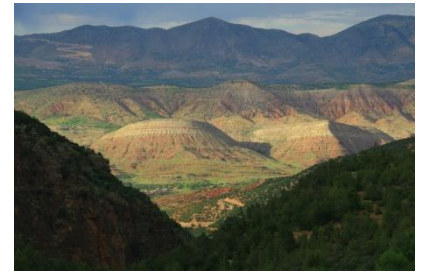
Die Bergwelt um Azrou

Am Donnerstag, den 17.10. kommen wir auf dem CP Zebra ( Zimmer gibt es auch dort ) in Ouzoud an, http://www.campingzebra.com/pages/ger/index.html .