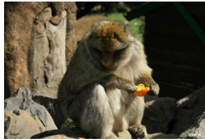
Berberaffe beim Dinner