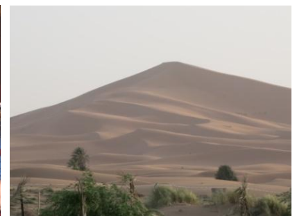
Wüstenfahrt im Erg Chebbi