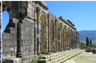
Die antike Stadt Volubilis

Auf dem Weg nach Fes am Dienstag, den 15.10. kommen wir nach Volubilis, eine römischen Stadt, die kurz vor Christus gegründet wurde. Eine Besichtigung ist eingeplant. Es geht dann an der Königsstadt Meknes vorbei nach Fes ( 260 km ). Wir übernachten auf dem CP „Diament Vert“. Der Campingplatz hat auch Bungalows. Am frühen Abend machen wir eine Stadtbesichtigung ( Medina ) mit einem Führer. Der Bus wird gechartert. Ein typisch marokkanisches Abendessen findet in einem Familien-Restaurant statt.