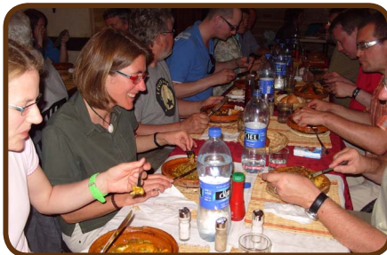
Essen am Place Djemaa el-Fnaa, auch Gauklerplatz genannt