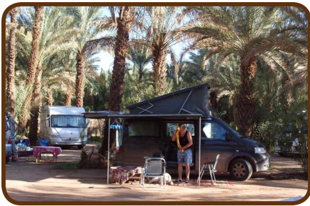
Der CP „Oase de Palmerie“

Wir bleiben in dieser schönen Oase bis Samstag, um zu relaxen und uns auf den Wüstenpart vorzubereiten. Die Zeit kann für einen Stadtbummel oder Shopping genutzt werden, aber auch für Reparaturen. Es gibt eine gute Werkstatt in Zagora.