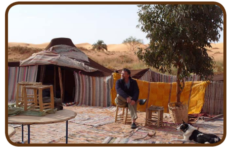
Übernachten im Nomadenzelt

Am Donnerstagmorgen, den 04.04. fahren wir vom Erg Chebbi in westliche Richtung und erreichen das fantastische Draa-Tal. Dort ist alles wieder grün und fruchtbar. Die Oase Zagora ist dann bald erreicht, und der Besitzer des CP „Oase Palmerie“ empfängt uns mit Tee und einem freundlichen Lächeln. Abends gibt es ein Daily-Adventure-Essen.