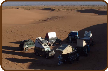
Das Camp am Erg Chegagga