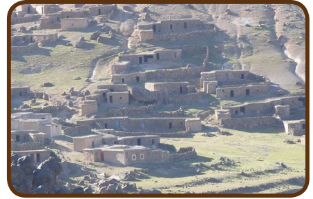
Im Tal der Ammeln

Am Montag, den 15.04. fahren wir auf einer sehr schönen Strecke nach Agadir und kaufen in einem großen Supermarkt ein, denn unsere Vorräte sind langsam am Ende. Der CP „Atlantica Parc“, der keine Wünsche offen lässt, liegt 30 km nördlich von Agadir und die Stadt ist schnell erreichbar, um Souvenirs zu kaufen. Wir machen am Mittwoch, den 17.04. ein Abschiedsessen für die 3-Wochen-Teilnehmer und genießen die Grill-Fischplatte im Restaurant in der Nähe des CP „Atlantica Parc“.