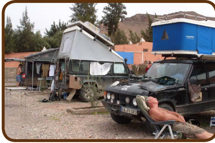
CP „Toubkal“ zum Relaxen