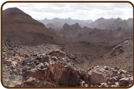
Richtung Erg Chebbi

Am 02.04. geht es über eine Off Road Strecke an den Rand der Sahara, zum Erg Chebbi. Auf dem Weg dorthin besuchen wir ein Fossilien-Museum. Dann tauchen die Dünen vom Erg Chebbi auf, und wir übernachten direkt an der größten Düne auf dem CP „Haven la Chance“. Wir bleiben 2 Tage, machen ein Wüsten-Fahrtraining mit Daily-Adventure und genießen eine Kameltour mit Wüstendinner und Übernachtung im Nomadenzelt.