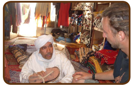
Shoppen in Zagora

Es geht dann am 06.04. für 3 Tage durch die Wüste. Auf den Spuren der Paris-Dakar müssen wir durch hohe Dünenkämme im Erg Chegaga, wo wir auch zwei Mal übernachten. Montagabend erreichen wir Agdez mit dem CP „Kasbah de la Palmerie“.