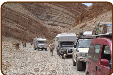
Expedition in großer Höhe

Am Ostersonntag nach dem Frühstück besichtigen wir die Wasserfälle und fahren auf einer Pistenstraße an den Rand des Hohen Atlas Richtung Imilchil. Wir übernachten unterwegs in über 2000m Höhe an einem kleinen See. Am nächsten Morgen geht es dann von Imilchil nach Agoudal, dabei erreichen wir einen der höchsten Pässe Marokkos: 2915 m hoch. Diese Tour hat Expeditionscharakter, da sie auch für uns neu ist. Am 01.04. sind wir auf dem CP Atlas in der Todhraschlucht.