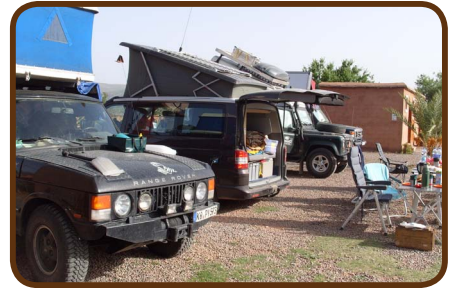
Zebra-CP in Ouzoud

Am Ostersonntag nach dem Frühstück besichtigen wir die Wasserfälle und fahren auf einer Pistenstraße an den Rand des Hohen Atlas Richtung Imilchil. Wir übernachten unterwegs in über 2000m Höhe an einem kleinen See. Am nächsten Morgen geht es dann von Imilchil nach Agoudal, dabei erreichen wir einen der höchsten Pässe Marokkos: 2915 m hoch. Diese Tour hat Expeditionscharakter, da sie auch für uns neu ist. Am 01.04. sind wir auf dem CP Atlas in der Todhraschlucht.