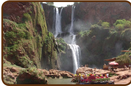
Wasserfälle bei Ouzoud