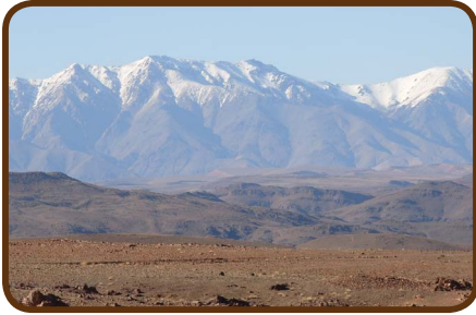
Blick auf den Toubkal 4167 m