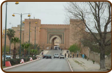
Meknes, eine Königsstadt

Am Karfreitag geht es auf der Autobahn über Rabat zur Königsstadt Meknes. Hier machen wir eine Stadtrundfahrt, einen Abstecher in die Medina, trinken Cafe au lait in einem gemütlichen Restaurant und fahren am Nachmittag zügig weiter zu unserem CP Euro Camping in Azrou. Dann geht es am Samstag weiter nach Ouzoud zum CP ZEBRA www.campingzebra.com/site/?p=83&lang=de und wir genießen ein marokkanisches A-bendessen, das uns speziell zubereitet wird.