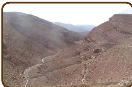
Das Gebirge der Todhra