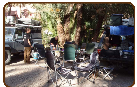
Der CP ATLAS in der Todhra