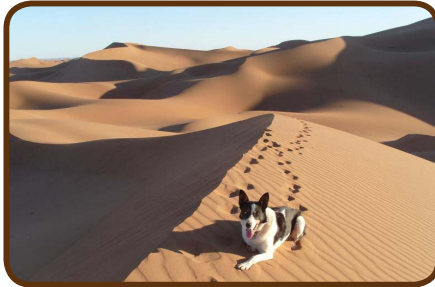
Tolle Dünen auch für Skye