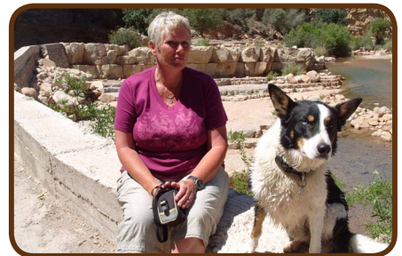
Tolle Schlucht bei Agadir

Wer noch länger bei uns bleibt, mit dem fahren wir nach Essaouira, dem Nizza Marokkos und bleiben dort ein paar Tage. Dann geht es über Moulay Bouselham wieder zur Fähre. Wir wollen spätestens am 26.04. zu Hause sein.