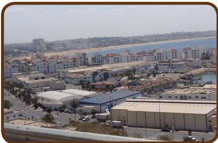
Die Stadt Agadir mit Hafen

Am Montag, den 15.04. fahren wir auf einer sehr schönen Strecke nach Agadir und kaufen in einem großen Supermarkt ein, denn unsere Vorräte sind langsam am Ende. Der CP „Atlantica Parc“, der keine Wünsche offen lässt, liegt 30 km nördlich von Agadir und die Stadt ist schnell erreichbar, um Souvenirs zu kaufen. Wir machen am Mittwoch, den 17.04. ein Abschiedsessen für die 3-Wochen-Teilnehmer und genießen die Grill-Fischplatte im Restaurant in der Nähe des CP „Atlantica Parc“.