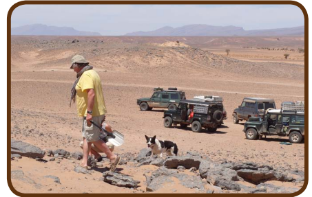
Wir finden auch Fossilien!

Am Dienstag fahren wir auf einer Teerstraße über den Hohen Atlas nach Marrakech. Nach einem Einkauf für einen Grillabend in der „Marjane“ übernachteten wir auf dem CP „Le Relais de Marrakech“. Mit dem Taxi in die Stadt zu fahren kostet 5 Euro, der Place Djemaa el-Fnaa ist wie aus einem Märchen. Auf einer Dachterrasse speisen wir auf Kosten von Daily-Adventure am Mittwoch, den 10.04. Es ist der Abschlussabend, denn am nächsten Morgen fährt ein Teil der Gruppe über die BAB zur Fähre nach Tanger.