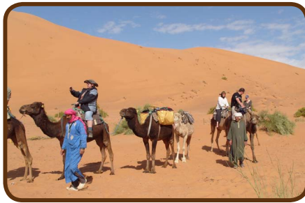
Kamel oder lieber zu Fuß ?