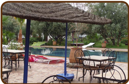
Der CP in Marrakech

Am Dienstag fahren wir auf einer Teerstraße über den Hohen Atlas nach Marrakech. Nach einem Einkauf für einen Grillabend in der „Marjane“ übernachteten wir auf dem CP „Le Relais de Marrakech“. Mit dem Taxi in die Stadt zu fahren kostet 5 Euro, der Place Djemaa el-Fnaa ist wie aus einem Märchen. Auf einer Dachterrasse speisen wir auf Kosten von Daily-Adventure am Mittwoch, den 10.04. Es ist der Abschlussabend, denn am nächsten Morgen fährt ein Teil der Gruppe über die BAB zur Fähre nach Tanger.